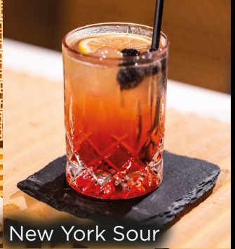
New York Sour