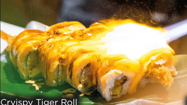
Crispy Tiger Roll