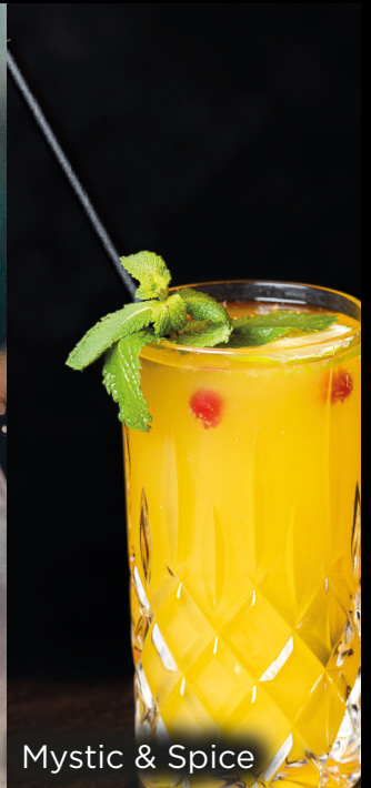
Mystic & Spice