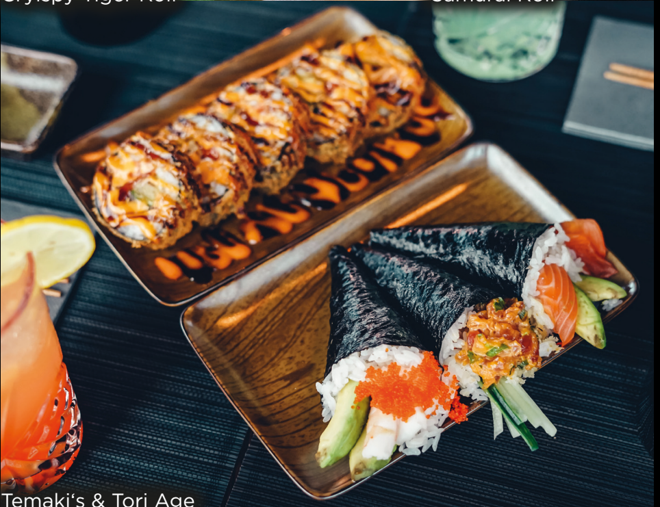
Temaki's & Tori Age