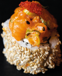
Sake Tatar Roll