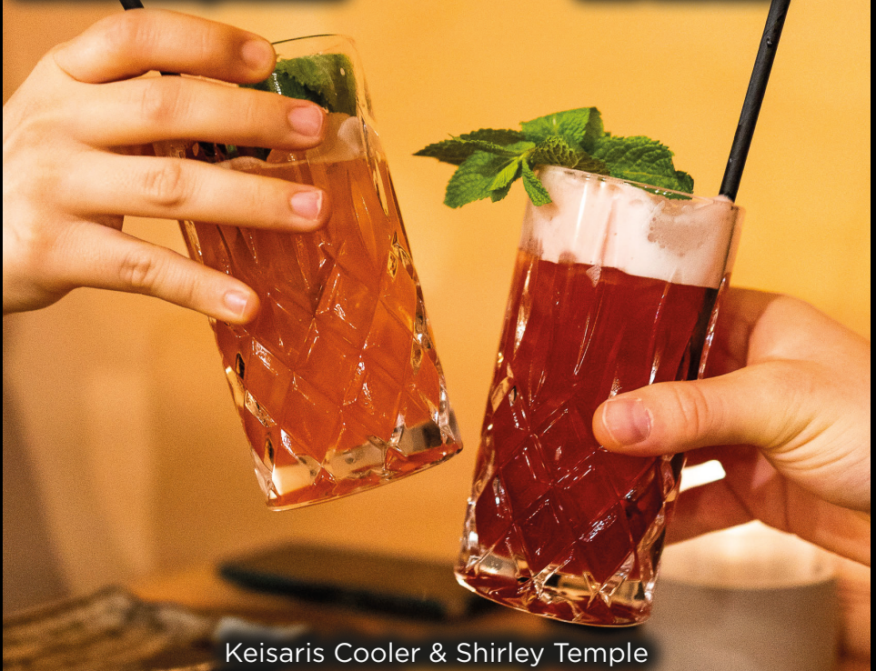
Keisar's Cooler & Shirley Temple