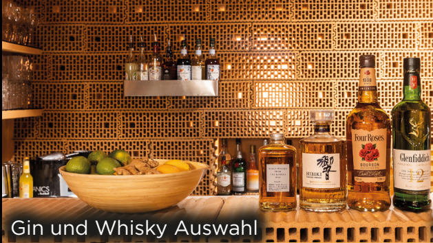
Gin und Whisky Auswahl