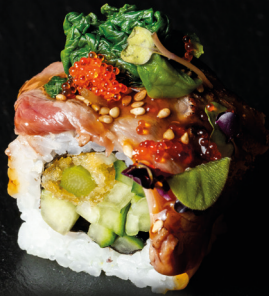
Leek Beef Roll